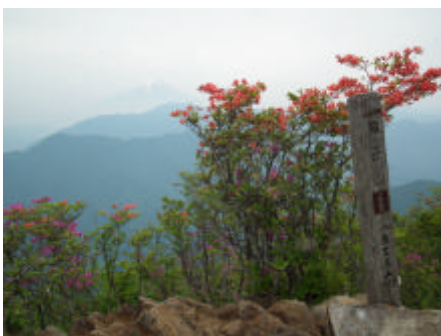
頂上のツツジと三つ峠と富士山