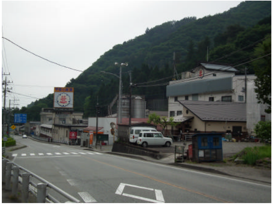
駅近くの笹一酒造 見学は9時半から