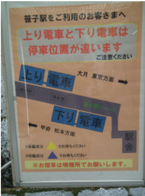
笹子駅のホーム 後の車両に