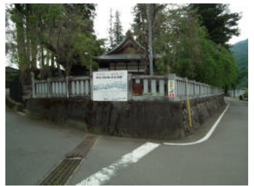
バス停近くの神社